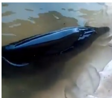
Foto: Ministerio de Medio Ambiente (MARN), 26 de octubre de 2018. Recuperada de: @MARN_SV

Habitantes de la zona de la playa San Marcelino, en el departamento de La Paz, encontraron este viernes un delfín nariz de botella, que estaba varado a la orilla de la playa.